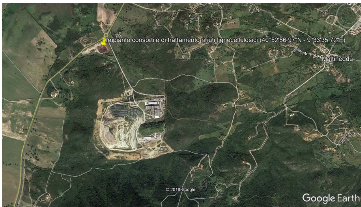
Figura 1: Ubicazione impianto

L'impianto in questione è ubicato in Loc Spiritu Santu nel Comune di Olbia, come individuabile dal seguente stralcio dell'immagine satellitare (fonte: Google Earth):